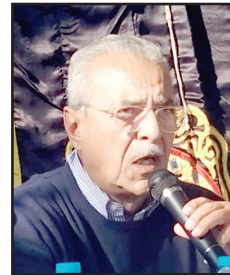
اللواء صلاح الدين زيادة