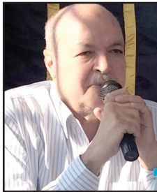
اللواء أبو القاسم أبو ضيف

وبعد المناقشة طالب الأعضاء المنتفعون بتأجيل خصم المديونية من المبلغ المذكور، وخصمها من ال ٧٠٪ المستحقة على المشتري، وأفاد مجلس إدارة الجمعية بأنه سوف يتم اعداد مذكرة شارحة الى الاتحاد لأخذ الرأى