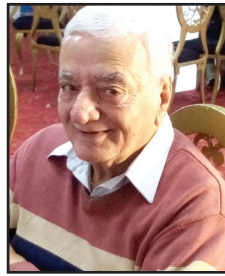
اللواء سامى العايدي