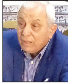
اللواء نبيل الحوتى