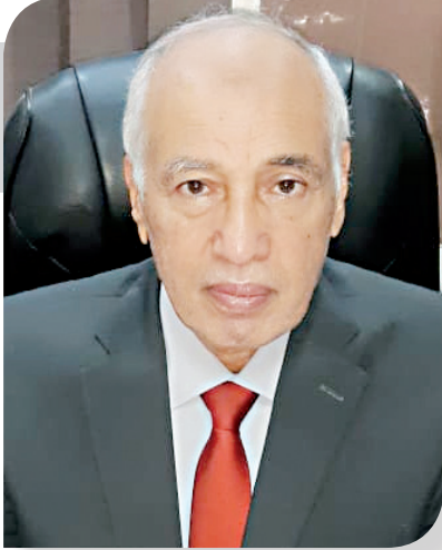
لواء عبدالوهاب ابوالصفا نائب ثان رئيس الاتحاد