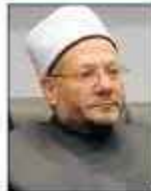
د. شوفى علام

أكد د. شوفى علام مفتى الجمهورية، انه لا مانع شرعا من تنظيم النسل ايا كان السبب، سواء لحاجة او لامر ضرورى فهذا التسبب لا يمنع ولا يتعارض ابدا مع قضاء الله واصاف ان القضية السكانية من القضايا المهمة لتكونها بحس الامن الفكرى والامن الفوضى وتنتطلب علاجا حاسما لتفادي الازمات الاقتصادية المترتبة عليها، ولا تباطؤها ببعض الافكار المغلوطة التى ترى ان تنفيذها وحلها يتعارض مع المشيئة الالهية.