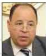
د. محمد معيط

المصروفات العامة مقابل ٢١٪ في العام المالي الماضي، وبلغت مخصصات برامج الدعم السلعي ١١٥,١ مليار جنيه منها ٨٤,٥ مليار جنيه لدعم السلع التموينية، وأشار إلى انه يستفيد من دعم ريف الجيزة وبقية المستوطنات نحو ١٩,٧ مليون مواطن كما يستفيد من دعم البطاقات التموينية ١٣,٥ مليون مواطن، وقد تمت إضافة حزمة من الإجراءات التي تسهم في تحسين الأوضاع المالية للعاملين بالدولة بتكلفة إضافية للأجور بلغت ٣٤ مليار جنيه، أوضح الوزير ان الرامية لدعم المنظومة الصحية وتطوير اداء الخدمة، وتوفير الرعاية الطبية اللائقة للمصريين ومنها: ١٠٠٠ مليون صحة، جبا إلى جنب مع مواجهة فيروس كورونا المستجد وتنفيذ المشروع القومي للفحص الصحي الشامل الذي يحقق حلم كل المصريين في مد مظلة التغطية الصحية لكل افراد الأسرة، وأشار إلى انه تم رصد ٧ مليارات جنيه بالموافقة الحالية للعلاج على نفقة الدولة.