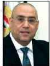
د. عاصم الجزار

أكد الدكتور عاصم الجزار وزير الإسكان والمرافق والمجمعات العمرانية، الانتهاء من نحو ٧٠٪ من أعمال الهيكل الخرساني للعمارات السكنية بمشروع تطوير سور مجرى العيون أواخر فبراير الجارى ونحو ٢٠٪ من أعمال النشاطات الداخلية والخارجية بالمشروع. وأوضح الجزار خلال تفقده المشروع لمتابعة الموقف التنفيذي ان الوزارة تولي تطوير منطقة سور مجرى العيون بمساحة ٩٥ هكتارا، وتشتمل تنفيذ عمارات سكنية وسول جارى وفندقى وسطاعم وكافيتريات وازارات سياحية وغيرها. ويجرى الانتهاء من النشاطات الداخلية والخارجية لعمارتين بالمشروع كمنودج لأعمال النشاطات