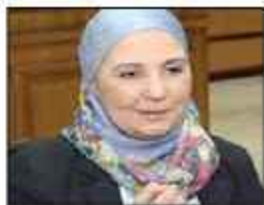
د. يهيا القباحي وزير التضامن

وتضمنت الخطط التنموية توفير الخدمات التعليمية والصحية والشبابية وخدمات الطب البيطري وخدمات التضامن الاجتماعي بناء على تطبيق