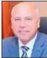
م. كامل الوزير

الزمالك والكيت كات بطول ٩٢٩ مترا. من جانبه أكد المهندس كامل الوزير ان المرحلة الثالثة من الخط الثالث بطولها ١٧٧ كم وتشتمل على ١٥ محطة وان نسبة الاجاز الكلية ٢٩٪ وسيتم افتتاح الجزء الاول منها، والذي يصل من محطة «العتبة» حتى محطة «الكيت كات» بطول ٤ كم بيسبتمبر القادم اما الجزء الثالث من روض الفرج بطول ٦.٦ كم فسوف يبدأ التشغيل في يونيو ٢٠٢٢ والجزء الثالث من روض الفرج ٦.٦ كم من محطة «الكيت كات» حتى محطة «جاسعة القاهرة» بطول ٧.١ كم مقرر ان يكون في ابريل ٢٠٢٢ وأشار الى ان تكلفة المرحلة الثالثة تبلغ ٤.٠٧ مليار جنيه فيما تبلغ التكلفة الاجمالية للخط الثالث ٩٧ مليار جنيه.