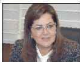
د. هالة السعيد وزيرة التخطيط

وأضافت أن وزارة التخطيط قامت مؤخرا باطلاق اول منظومة متكاملة إلكترونية للمبادرة والتي تهدف الى حصر الاحتياجات التنموية للقرى المستهدفة، واعداء خطة التدخلات المُنفَّذة، ومناقشة وتقييم أثر كافة الجهود على حالة التنمية وجودة الحياة ودمج قواعد بيانات الجهاز المركزي للتعبئة العامة والاحصاء والاستفادة منها في صنع القرارات التخطيطية اضافة التي تكاملها مع منظومة التغييرات للكائمية مع اعتمادها على منهجية خطط البرامج والأداء التي تربط بين الاعتمادات الموجهة للمشروعات والعتاد التنموي المستهدف منها، فضلا عن حسابها التفلفاني واللحظي لمؤشر جودة الحياة الذي اطلقته الوزارة مؤخرا.