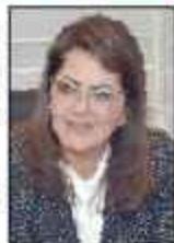
د. هالة السعيد

وفتد د هالة السعيد، وزيرة التخطيط والتنمية الاقتصادية على زيادة مخصصات الهيئة العامة للطرق والكبارى للعام المالي الحالي بمبلغ ٤٥٠ مليون جنيه، وذلك في إطار حرص الوزارة على ازالة العقبات التي قد تؤثر سلبا على سير العمل بمشروعات الطرق والكبارى التي تقوم بتنفيذها وزارة النقل وأكدت على اهمية مشروعات الطرق والكبارى، خلق مجتمعات عمرانية جديدة ودفع عجلة التنمية الزراعية والصناعية والسياحية وغيرها، وأشارت إلى ان قطاع النقل من اهم القطاعات التي يتم الاستثمار بها، وذلك في ضوء الأجندة الوطنية للتنمية المستدامة، رؤية مصر ٢٠٣٠، وكان من نتائج ذلك ارتفاع تصنيف مصر وفقا لمؤشر التنافسية الدولية في مجال جودة الطرق والبنية التحتية من المركز ١١٨ عام ٢٠١٤ إلى المركز ٢٨ عام ٢٠١٩.